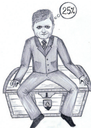
Ilustrácia: Lucia Krempaná

Myšlienka zavedenia rovnej dane v našom daňovom systéme nebola a nie je zlá. Hlavnou výhodou rovnej dane je prehľad v daňovom systéme, jednoduchá orientácia v labyrinte priamych a nepriamych daní, znižujú sa náklady na administratívu a správu daní. Zníženie nákladov sa prejaví nielen na strane daňovníkov, ale aj na strane správcu dane. Rovná daň však musí byť rovná nielen tým, že je jedna, resp. rovnaká sadzba dane, ale rovnosť dane sa musí prejavíť u všetkých daňových subjektov v rovnosti podmienok pri zdaňovaní príjmov. Táto rovnosť však u nás nie je zabezpečená. Uvediem to ďalej na konkrétnom príklade. Na Slovensku platí, že všetko čo sa dá zneužiť sa aj zneužije. Tak je to aj s našou „rovnou“ daňou. Tvorcovia rovnej dane túto rovnosť porušili ako prví tým, že zaviedli 20% daň z pridanej hodnoty argumentujúc akýmsi znižovaním deficitu štátneho rozpočtu. Ale, ak už chceli naozaj znížiť deficit, mohli zvýšiť sadzbu všetkých daní a neporušili by tak zásadu rovnej dane. Ak sa pozrieme