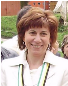
Starostka obce Osturňa