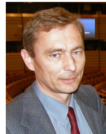
Starosta obce Lechnica

V rámci naplňania aktivít pre všestranný rozvoj obce ma veľmi teší, že z finančných zdrojov, ktoré obec má, sa podarilo uskutočniť z ôsmich stanovených cieľov až štyri úplne (údržba sociálnych zariadení v sále kultúrneho domu, údržba oporných múrov v potokoch Rieka a Potok, osadenie dopravných značiek na všetkých miestnych komunikáciách, výsadbu 700 kusov drevín na verejných priestranstvách) a dve ďalšie aktivity sme už aj začali realizovať (údržbu miestneho rozhlasu, výroba a osadenie lavičiek so smetnými košmi v obci). Iné plánované aktivity sa nám nepodarilo splniť z dôvodu vysokej finančnej náročnosti. Zarmucujúcim faktom v obci Matiašovce je hlavne demografický vývoj. Vo všeobecnosti obyvateľstvo Zamaguria starne, ale v našej obci sú čísla alarmujúce. V roku 2012 sa doposiaľ narodili iba 2 deti (mimochodom do konca roka nemáme vedomosť o ďalšom prírastku) a dúfam, že počet úmrtí sa zastaví na dnešnom čísle 11.