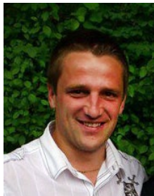
Starosta obce Matiašovce