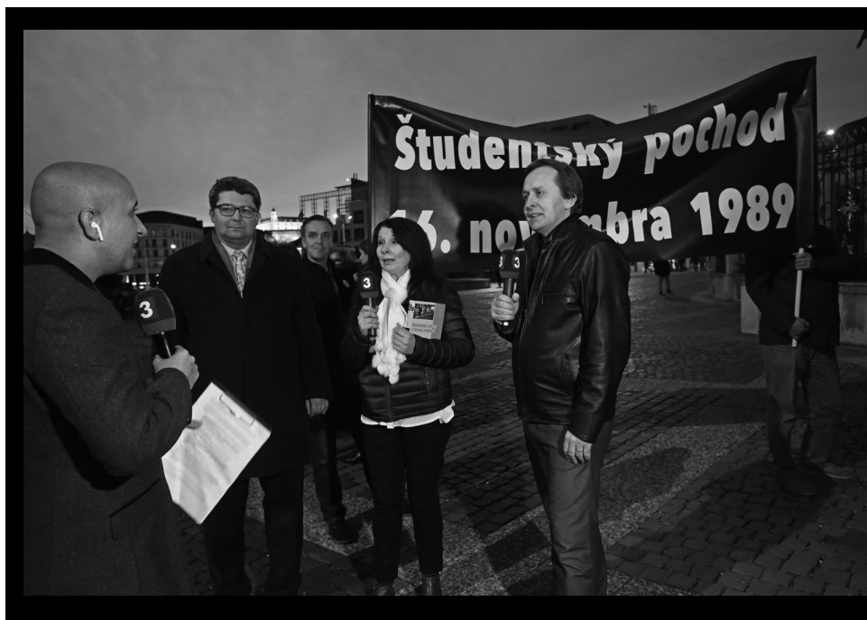
Presne po 30 rokoch – 16.11. 2019, počas úspešnej rekonštrukcie pochodu zo 16.11. 1989, sa jeho účastníci „na kameru“ vyjadrovali už bez obáv z možných následkov...